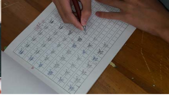
圖四:學生上課之習字本練習