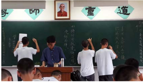
圖三:學生上課上台練習