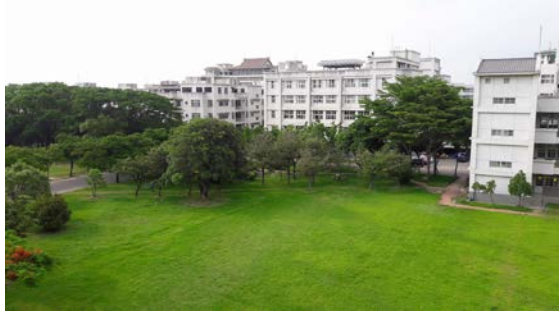
圖一:福智教育園區