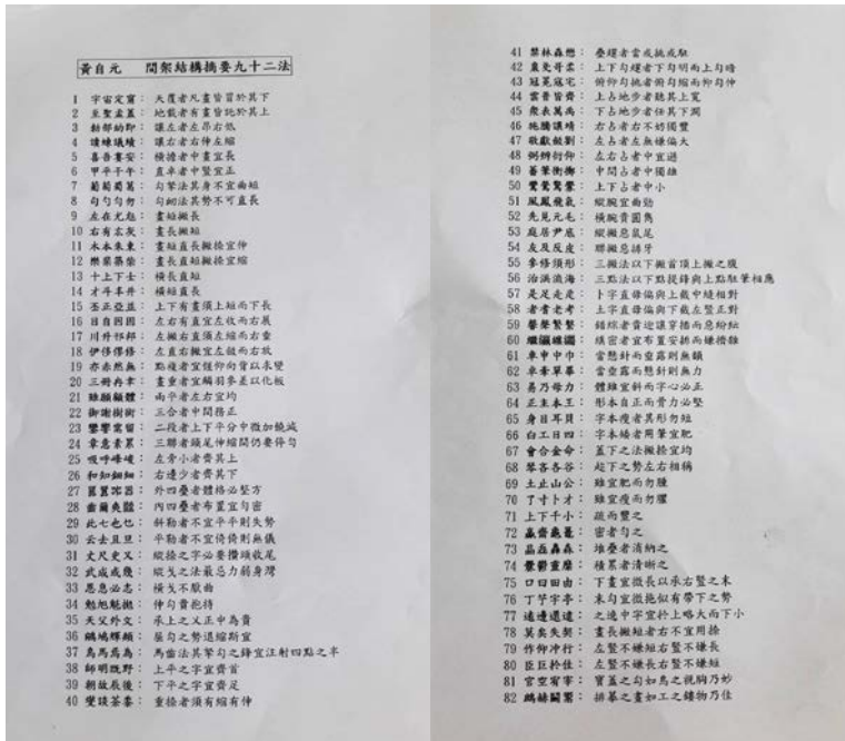
圖七:上課教材之一-黃自元開架九十二法