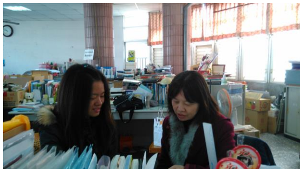
訪談中學教師(以上三張照片)